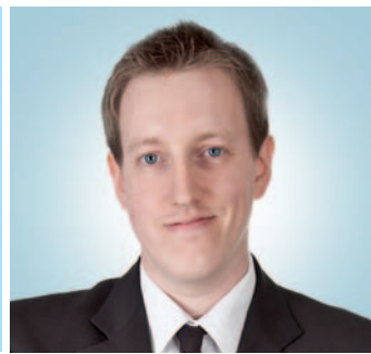
Moderation: Christoph Damm Deutsches Anleger Fernsehen